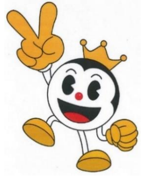
(全日遊連マスコットキャラクター：パチロー)